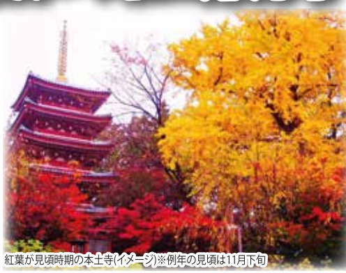
紅葉が見頃時期の本土寺(イメージ)※例年の見頃は11月下旬