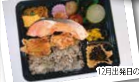
12月出発日の弁当(イメージ)