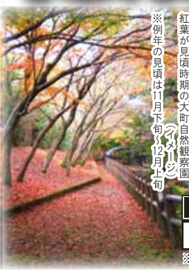
紅葉が見頃時期の大町自然観察園 ※例年の見頃は11月下旬～12月上旬