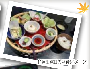
11月出発日の昼食(イメージ)