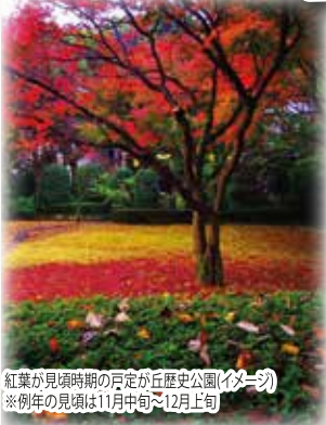
紅葉が見頃時期の戸定が丘歴史公園(イメージ) ※例年の見頃は11月中旬～12月上旬