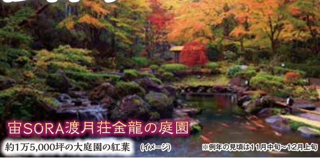
宙SORA渡月荘金龍の庭園