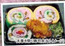
太巻き祭り寿司弁当(4人分)